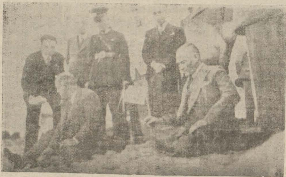
Atatürk Viran şehrinde istirahat buyururlarken