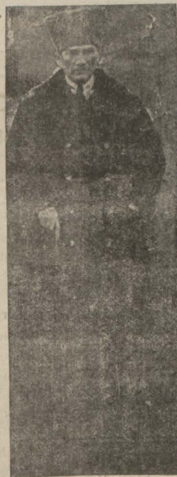
Gazi Mustafa Kemal'in şehrimizde alınmış tarihî bir resimleri

Bir hazan ruzgârı gibi figanla; Bir köyden bir köye dolaşıyorsun.