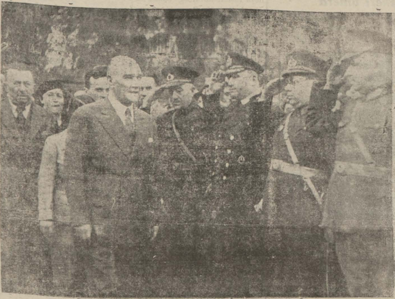
Atatürkün şehrimizi son ziyaretlerinden bir intiba

On altı sene evvel bu asil Türk milleti Atasını nasıl sevmişse; bugün de aynı sevgi ve saygı ile onu kalbinde yaşatıyor. Onun rejimine, inkılâbına kurduğu büyük partisine aynı surette sevgisi-