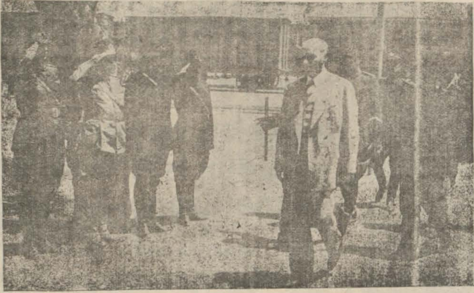
Atatürk istasyona geldiklerinde askeri umera tarafından selâmlanırken